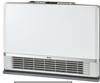
温水ルームヒーター